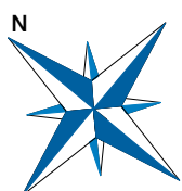
PLAN TRAVAUX MODIFICATIFS ACQUÉREURS | ÉCHELLE : 1/100°