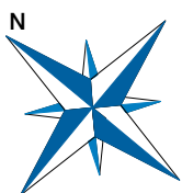
PLAN TRAVAUX MODIFICATIFS ACQUÉREURS | ÉCHELLE : 1/100°